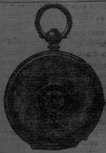
WEST END WATCH Key winding Lever watch full jewelled Guaranteed for four years

Manager } ମାଡେକର Spermatine Depot } ସାରମାଟିକ ଉପକ No. 22 Baranasi } ତ ୨୨୨ର ବାଦମା Ghose's street } ଗୋଷ୍ଠୀ Calcutta. } ଦରଦା